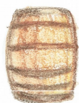
Caratello lt. 25-200