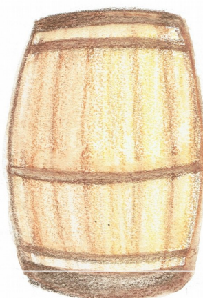
Tonneau lt. 500