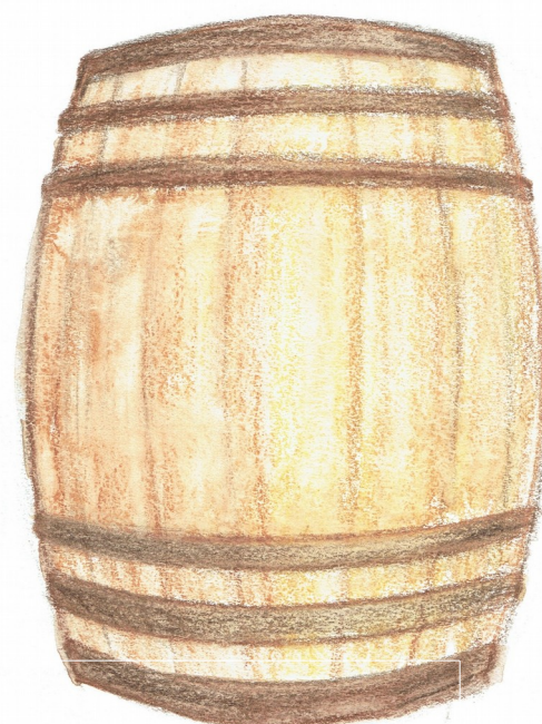
Botte lt. più di 500