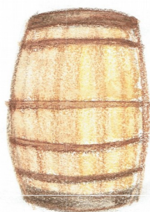
Barrique lt. 225